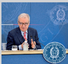
Alfredo Mantovano Sottosegretario alla presidenza

L'allarme dell'Agenzia delle Entrate sul phishing riguarda mail, telefonate e invio di documenti contraffatti. Attenzione a saper riconoscere la truffa.